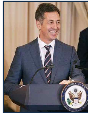
미국대통령이 보낸 동성애 전도사 베리 순방했다.

이 동성애자 랜디 베리 특사는 아시아 국가들의 동성애와 동성결혼 합법화, 특히 '동성애차별금지법' 제정을 피하기 위해 이미 2016년 1월 30일부터 아시아 6개국(대만, 인도네시아, 태국, 베트남, 한국, 일본)을